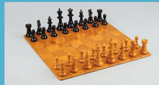
Schachspiel, um 1940

Anmeldung erforderlich unter mail@chessclub4kids.eu