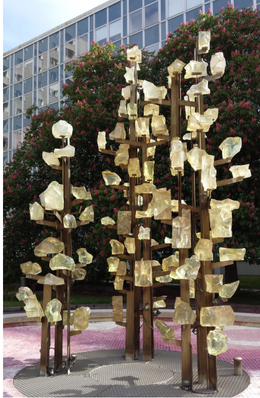
Hyazinthenbrunnen von Leoni Wirth, 1974, Foto: Privatbesitz, 2016 Titel: Siedlerfest in der Holzhaussiedlung Stetzsch, ca. 1927, Foto: Privatbesitz

Veranstaltungsort Stadtmuseum Dresden, Wilsdruffer Straße 2, (Eingang Landhausstraße), 01067 Dresden