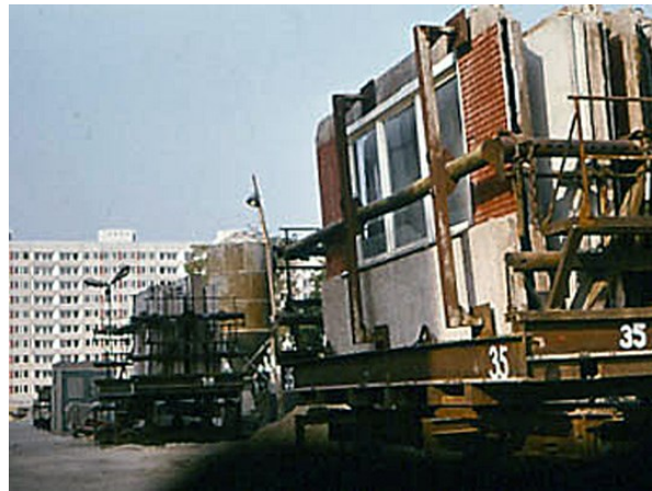
Plattentransport in Johannstadt, 1973, Foto: Jochen Hänsch